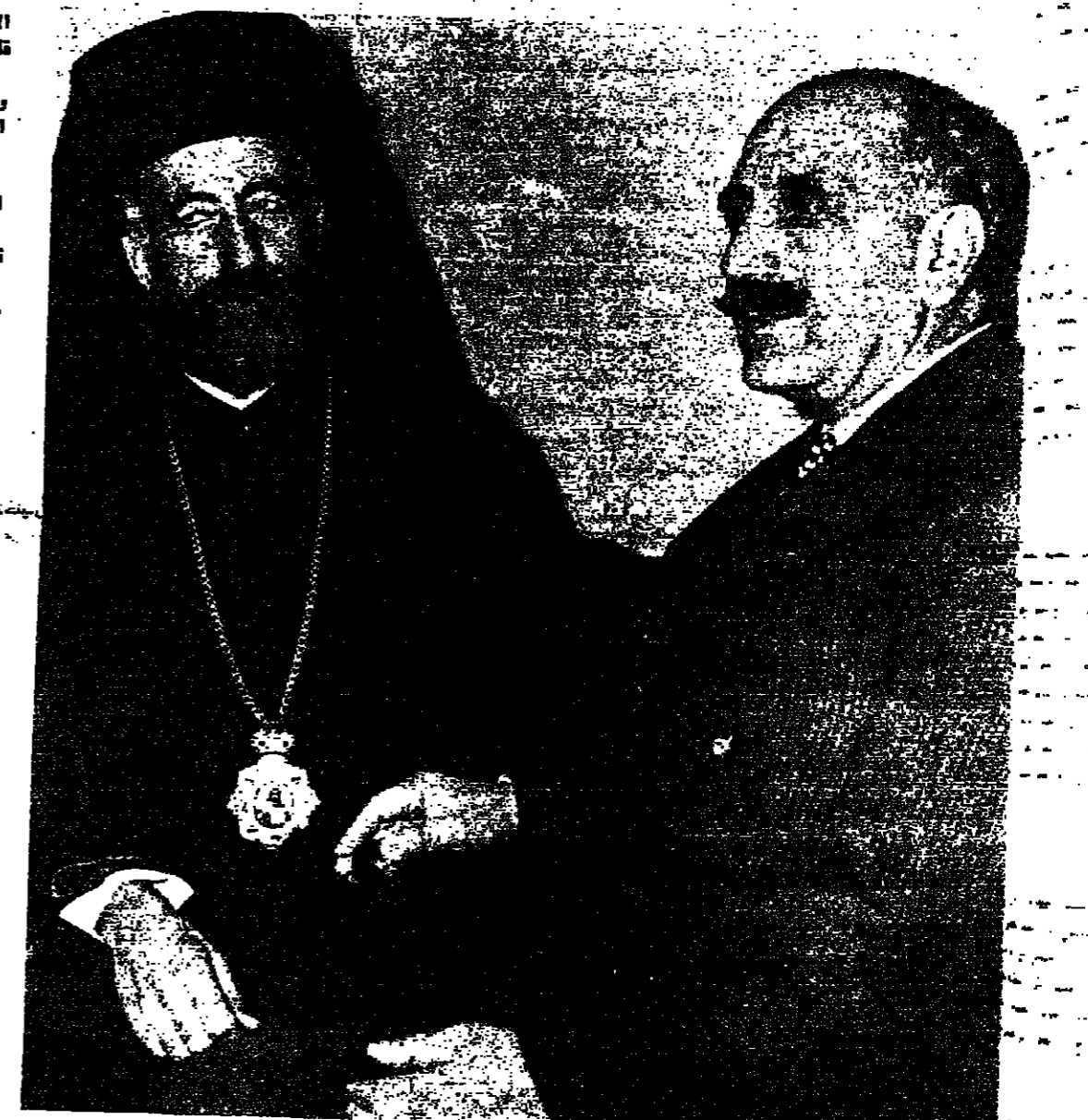
مع جورج فرغياس رئيس منظمة « ايوكا »

نجا الرئيس القبرصي ورئيس الاساقفة مكاريوس الذي توفي امس من نوبة قلبية عن ٦٢ سنة ، من عدة محاولات لاقتلته ، ومن انقلاب عسكري خلال اكثر من ٢٠ سنة قضاها في خدمة المصروف في المسرح السياسي المتحجر في جزيرة قبرص . وقد مكاريوس نجل الرامي جزيرته الى الاستقلال في سنة ١٩٦٠ وامسج اول رئيس للجمهورية في شهر تونر طلائفي انقشافي ومناخسة بريرة بين الحائزين اليونانية والتركية . وكانت احلك شامات حياته في سنة ١٩٧٤ عندما اطاح به الحزب الوطني القبرصي الذي يقوده ضابط يونانيون في شهر تموز ، وكان ان يقعد حياته في هجوم على قصر الرئاسة . واضطر مكاريوس الى الفرار من الجزيرة ، وذهب الى لندن حيث راقبها من بعيد قزى الاتراك للجزيرة . لكن مكاريوس لم يشك ابدا في ان مسجده سيكون العودة . وقد عاد فعلا بعد اربعة اشهر ونصف الشهر ، واستقبله الصغار القبارصة اليونانيين استقبال الاطال الفاتحين . وكانت المشكلات السياسية والاقتصادية التي واجهته اذالك هائلة . فالاقتصاد كان منهارا ، والقلق متفردة بين القبارصة اليونانيين والقبارصة الاتراك ، والاحتلال التركي للجزر الشمالي من الجزيرة ، قائم ، بالإضافة الى وجود مشكلة لاجئين يبلغ عددهم حوالي ثلث سكان الجزيرة . الا ان المشكلات المستعصية كانت من الامور التي عاينها مكاريوس منذ ان بدأ طريقه نحو السلطة السياسية في مطلع الخمسينات . فقد كان زعيما سياسيا وروحيا اذ كان رئيسا للكنيسة الارثوذكسية فسي تيوس . وكانت طريق مكاريوس نحو السلطة السياسية في الخمسينات شائكة واحيانا